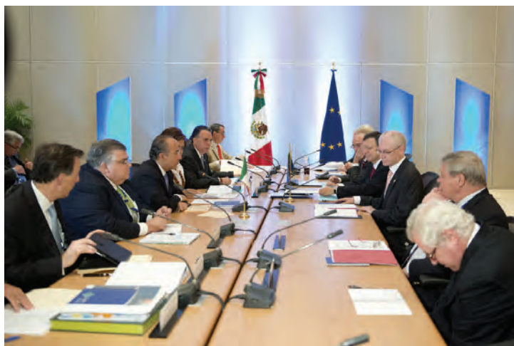
Felipe Calderón Hinojosa, Presidente de México, encabezó la sexta Cumbre entre México y la Unión Europea.