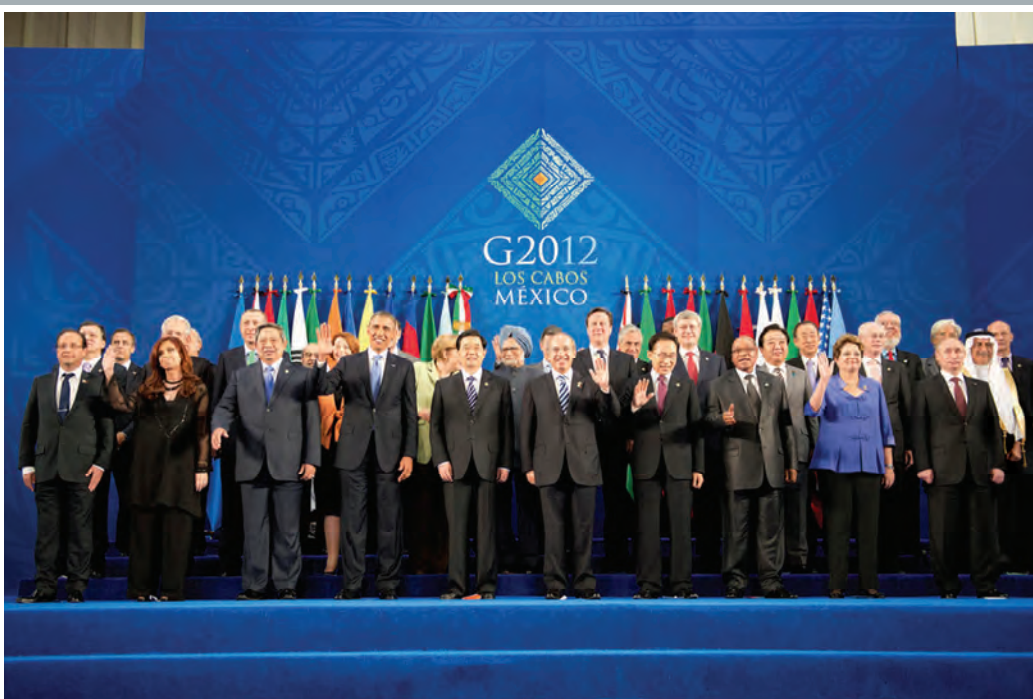
Felipe Calderón Hinojosa, Presidente de México, con los Líderes del G20 en la Cumbre de Los Cabos