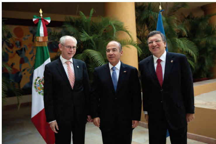
Herman Van Rompuy, Presidente del Consejo Europeo; Felipe Calderón Hinojosa, Presidente de México; y José Manuel Durão Barroso, Presidente de la Comisión Europea.

En cuanto a la agenda multilateral, una vez más se evidenció la concordancia de las posturas mexicana y europea en temas como el cambio climático y los derechos humanos, así como el intercambio de inquietudes y propuestas para seguir estrechando y profundizando los lazos de entendimiento y cooperación entre México y la UE. Por otro lado, se hizo patente el carácter estratégico de la relación, dejando constancia del excelente estado de la misma.