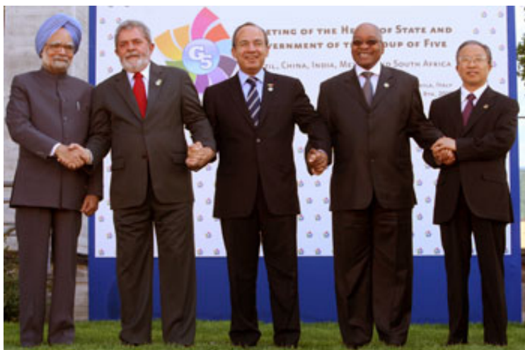
El Presidente de México, Felipe Calderón, presidió la Cumbre del G5 en Italia.

La agenda del G5 cubrió los temas más relevantes de la agenda mundial, tales como: crisis económica internacional, cambio climático, desarrollo, gobernabilidad global y seguridad alimentaria.